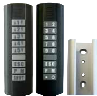
4080V000 4080V001 4641V000